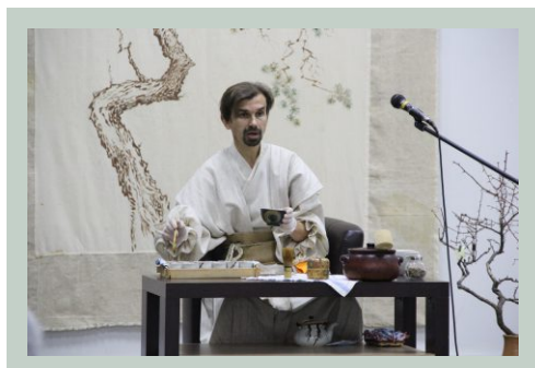
Акция «Ночь искусств»