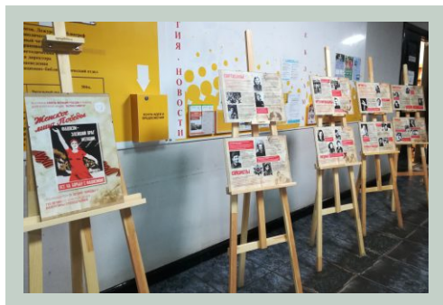
Планшетная выставка в рамках комплекса мероприятий к 75-летию Победы в Великой отечественной войне