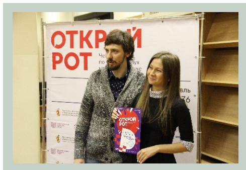
«Открой рот» региональный этап по чтению вслух