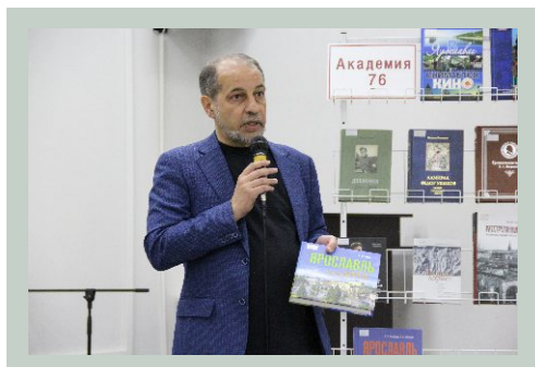
Фестиваль «Ярославская книга – 2019»